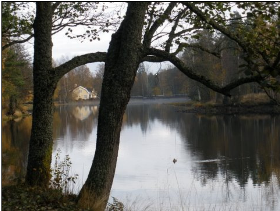
Bruksvägen mot dammen