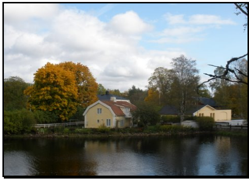
Pellamokko, foto Carina Wolf

Det övergripande målet är ett levande samhälle/bygd som ger förutsättningar för en god livskvalitet oavsett ålder och bakgrund. Ett samhälle/bygd som känns trygg, säker och inbjudande. Ett samhälle/bygd som gör det attraktivt att flytta till och vilja bo kvar.