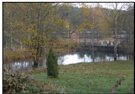
Vy från Smedjebacken

Slutligen – om alla krafter som finns i samhället – samhällsföreningen, alla föreningar, företag och eldsjälar samverkar finns goda förutsättningar att utveckla samhället. För att lyckas tror vi att någon form av utvecklingsgrupp, råd eller kommitté bildas, med representanter från alla aktörer i samhället.